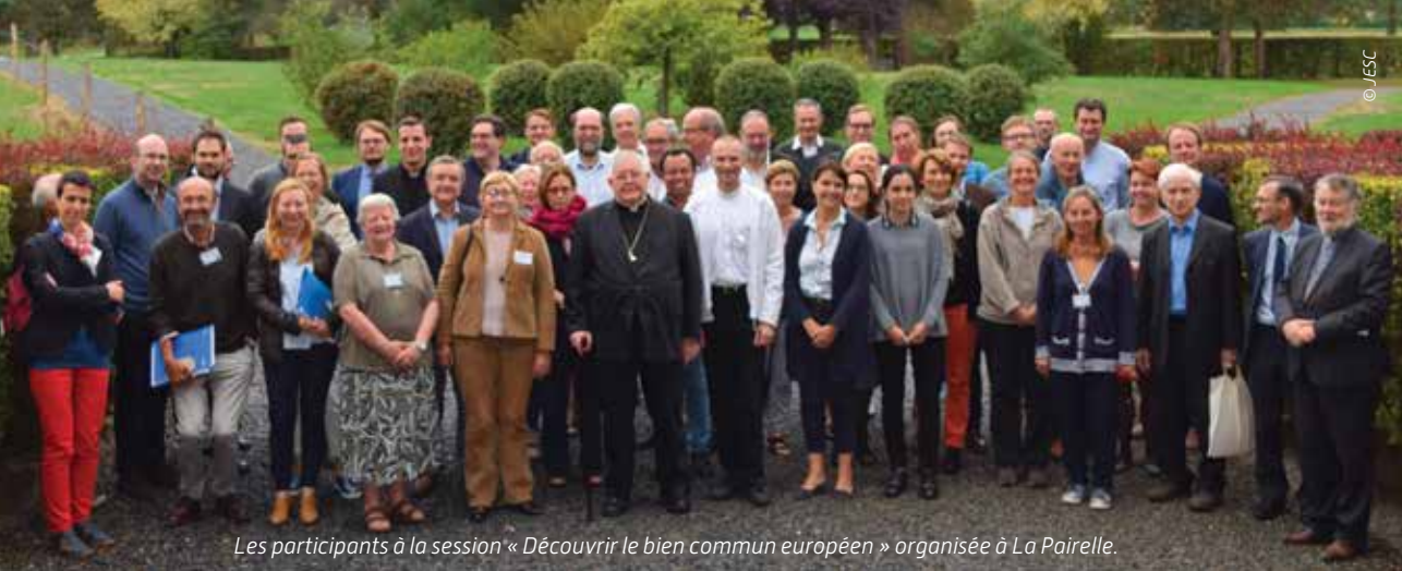
Les participants à la session « Découvrir le bien commun européen » organisée à La Pairelle.