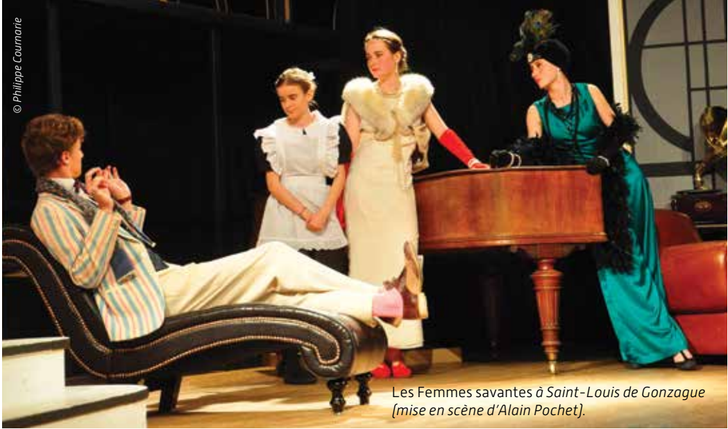
Les Femmes savantes à Saint-Louis de Gonzague (mise en scène d'Alain Pochet).