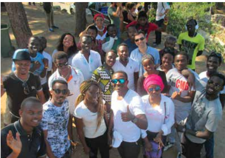
Rencontre entre des jeunes de notre communauté turcophone et de jeunes réfugiés irakiens.

À travers la paroisse, nous sommes également engagés dans les relations œcuméniques et interreligieuses. Chaque mois, pasteurs catholiques et protestants se retrouvent pour un temps de partage, tandis qu'à ce