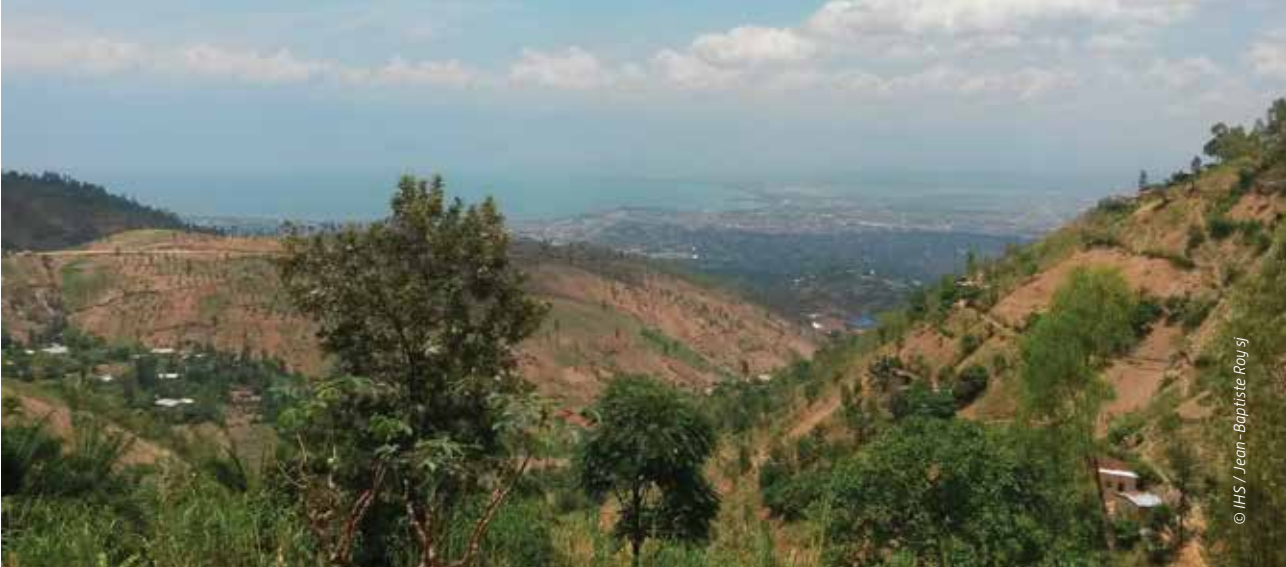
Vue sur la ville de Bujumbura depuis les collines.