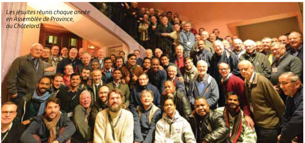
Les jésuites réunis chaque année en Assemblée de Province, au Châtelard.